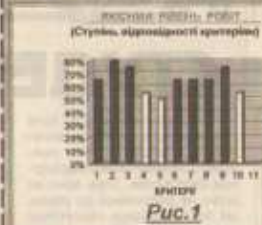
рис. 1) а також критерії № 2, 4, відпо-

Втім, precisely, що з такою суттєвими (хоч і менш вагомими) критеріями, як «формулювання актуальної теми дослідження», «встановлення мети, постановка завдань дослідження», «оформлення роботи», «якість логічної роботи», «якість електронної презентації» справлялися майже всі автори конкурсних робіт. Це свідчить про певну здатність дослідників, зважаючи на визначені сфери дослідницького пошуку (об'єкт і предмет дослідження), в цілому окреслити обсяг амбіційних наукових думок, а також належним чином оформити роботу і з певною корекцією представити її на суд журі та експертів.