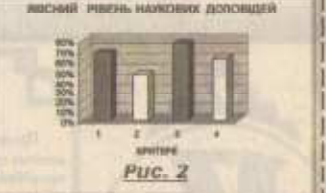
рис. 2) Майже повної відповідності зазначеним критеріям (на рівні 70-80 відсотків) досягли лише 5 – 15% авторських робіт і це – об'єктивна реальність, яка означає: кращі результати ще попереду.

відповіді на ЯКІСНИЙ РІВЕНЬ НАУКОВИХ ДОПОВІДЕЙ – «науковий стиль викладання, культура мовлення», «якість аргументації, вичерпність відповідей на запитання, рівень дискусій-